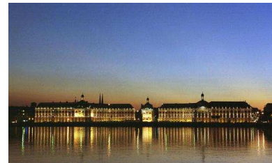
Bordeaux, place de la Bourse